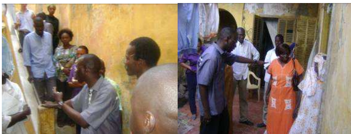
Visite des bâtiments en ruine et échanges du Maire avec les occupants