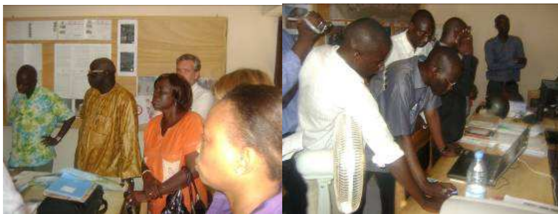
Visite Bureau du Patrimoine