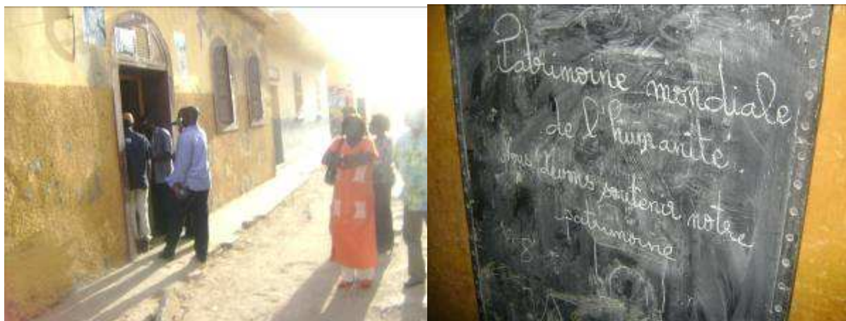
Le Maire dans au seuil d'une Maison de l'île