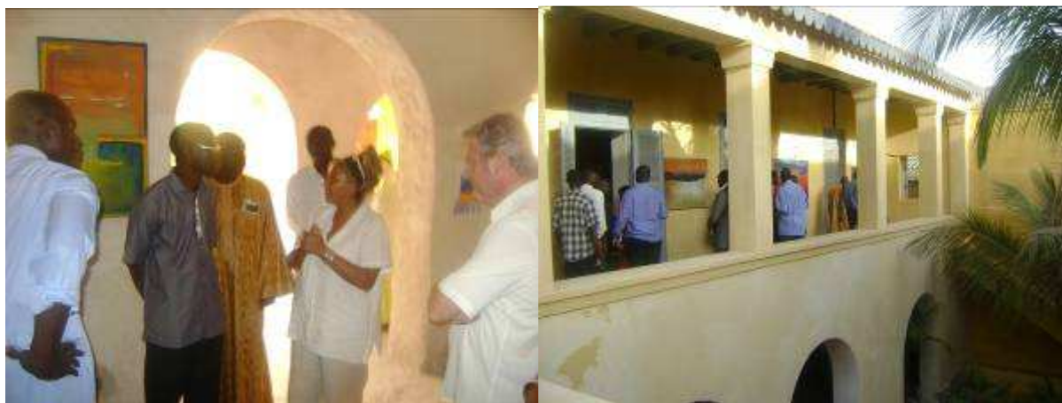
Visite d'une réhabilitation conforme